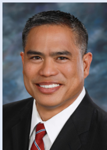
Gerente General, Distrito Central Golden State Water Company